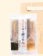
天然真鯛めで鯛ごはんの素 (3合用)

天然真鯛を三枚におろし、形よく焼き、アラを煮出して旨みを凝縮させた煮汁に酒などで調味し、最後に淡口醤油で仕上げました。 おめでたい席にはかせない逸品です。