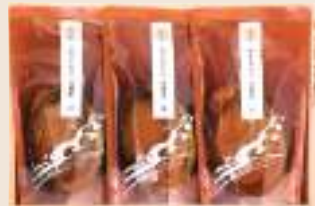
みやび 雅 参宮あわび姿脹煮3個(殻・肝付)