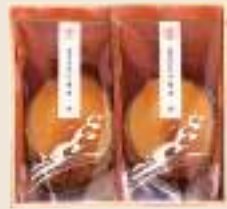
そうじゅう 双寿 参宮あわび脹煮2個(計200g)