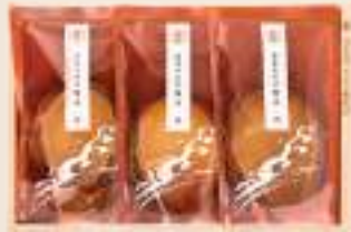
ふく 福 参宮あわび脹煮3個(計250g)