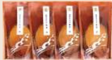
まい 舞 参宮あわび脹煮4個(計420g)