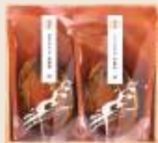
たから 宝 参宮あわび姿脹煮2個(殻・肝付)