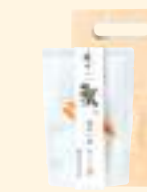
本ずわい蟹雑炊の素 (1食入) 雑炊の出汁(野菜入)・蟹肉×各1袋

冬の味覚を代表する蟹。中でも高級とされる本ずわい蟹で雑炊の素をおつくりいたしました。本品を火にかけてごはんを入れてとき卵を散らせれば、美しい蟹の身入りの濃厚な蟹雑炊が出来上がります。