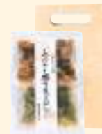
あおさと磯の貝ごはんの素 (3合用)

風味豊かな三重県産のあおさ・海苔。コハク酸の旨みを含んだ赤にし貝。それぞれが織りなす味のハーモニーを熱々の炊き込みごはんでお楽しみください。