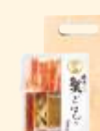
本ずわい蟹ごはんの素 (2合用)

冬の味覚を代表する蟹。中でも高級とされる本ずわい蟹をごはんの素に調製いたしました。立ちのぼる香味豊かな湯気とともに、蟹みそをのせた特製の濃厚な蟹出汁で炊く旨みたっぷりのごはんをお楽しみください。