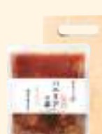
パエリアの素 洋風炊き込みごはん (3合用)

炊飯器で作る地中海料理「パエリアの素」。帆立、イカ、あさりなどの魚介や野菜を特製のスープとともに調製いたしました。 風味と旨みが食欲をそそります。