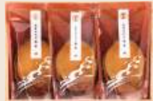
えん 縁 参宮あわび脹煮3個(計315g)