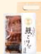
鰻ごはんの素 釜まぶし (2合用 ※お茶漬用出汁付)

国内産の鰻の蒲焼と特製のたれで炊き上げる「鰻ごはんの素」。まずはそのまま、お好みで添付の実山椒を添えて。二膳目は出汁茶漬に。三つ葉、ねぎ、わさびなどの薬味を添えていただくと、一層美味しくお召し上がりいただけます。