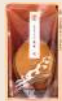
いちじゅう 一寿 参宮あわび脹煮1個(90g)