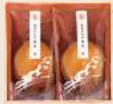
けいじゅう 慶寿 参宮あわび脹煮2個(計160g)