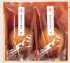
たま 珠 参宮あわび脹煮2個(計130g)