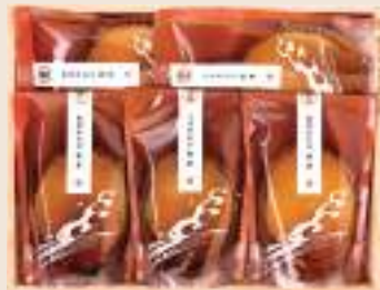
れい 麗 参宮あわび脹煮5個(計500g)