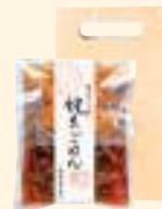
帆立ごはんの素 (3合用)

旨み豊かな帆立貝。その秀味な帆立と特製のたれ、独自の醬で調製した出汁で炊き上げる「帆立ごはんの素」。 帆立のkokのある旨みと独特の食感をお楽しみください。